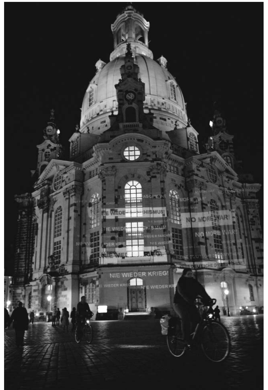
Filmprojektionen wanderten im Herbst 2009 über Fassaden der Dresdner Innenstadt

Roßberg sprach 2004 von den Luftangriffen als Beispiel für „Kriege, die immer noch als unmenschliche Tollheiten von Menschen unseren Erdball befallen“. Hier ist Dresden nicht Teil des nationalsozialistischen Deutschland, sondern in die überhistorische Kategorie „Krieg“ aufgelöst. Darüber hinaus kann diese Figur mit dem totalitarismustheoretischen Bild vom Schrecken des 20. Jahrhunderts arrangiert werden, in dem der Nationalsozialismus relativiert und alle Versuche zum Kommunismus über die Gewalttaten der Modernisierungsdiktaturen in deren Nachfolge diskreditiert werden. Die Extremismuskampagne ist in diesem Sinne die tagespolitische Variante der Totalitarismustheorie als bürgerlichem Ordnungsversuch der letzten geschichtlichen Epoche.