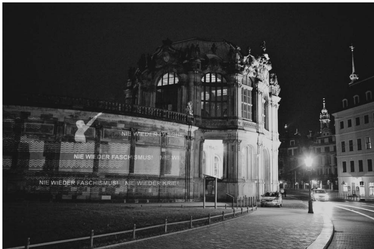
Auch auf dem Zwinger zeigten sich die „Schatten der Vergangenheit“

Im April erscheint das Buch „Erinnerung“ an und für Deutschland. Dresden und der 13. Februar 1945 im Gedächtnis der Berliner Republik“ des Autors im Verlag Westfälisches Dampfboot.