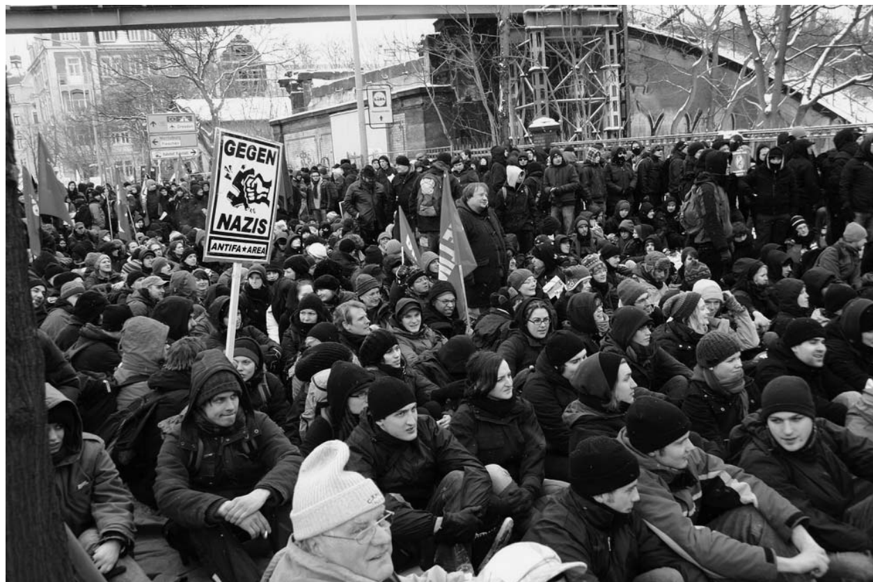
Hat trotz der klirrenden Kälte gut geklappt: Massenblockaden 2010 in Dresden

In Sachsen ist die sogenannte Extremismusklausel ja ziemlich gegenwärtig, unlängst hat das AKuBIZ Preisgelder abgelehnt, weil von ihnen verlangt wurde, eine „Extremismusklausel“ zu unterschreiben. (vgl. ak 556) Haben diese Diskussionen auch Auswirkungen auf eure Arbeit bzw. auf die Zusammenarbeit mit politischen Partnern?